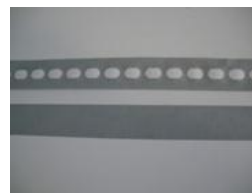
Open en dichte anti-dust tape